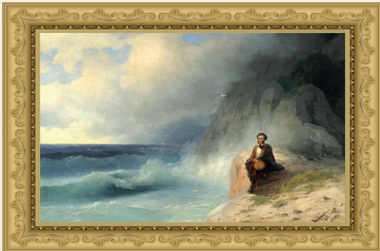
И. Айвазовский «Пушкин на берегу Чёрного моря» 1868 г

Море – ты в стихах воспето! Многих ты лишило сна; Море – муза для поэта! Море – песня для певца!