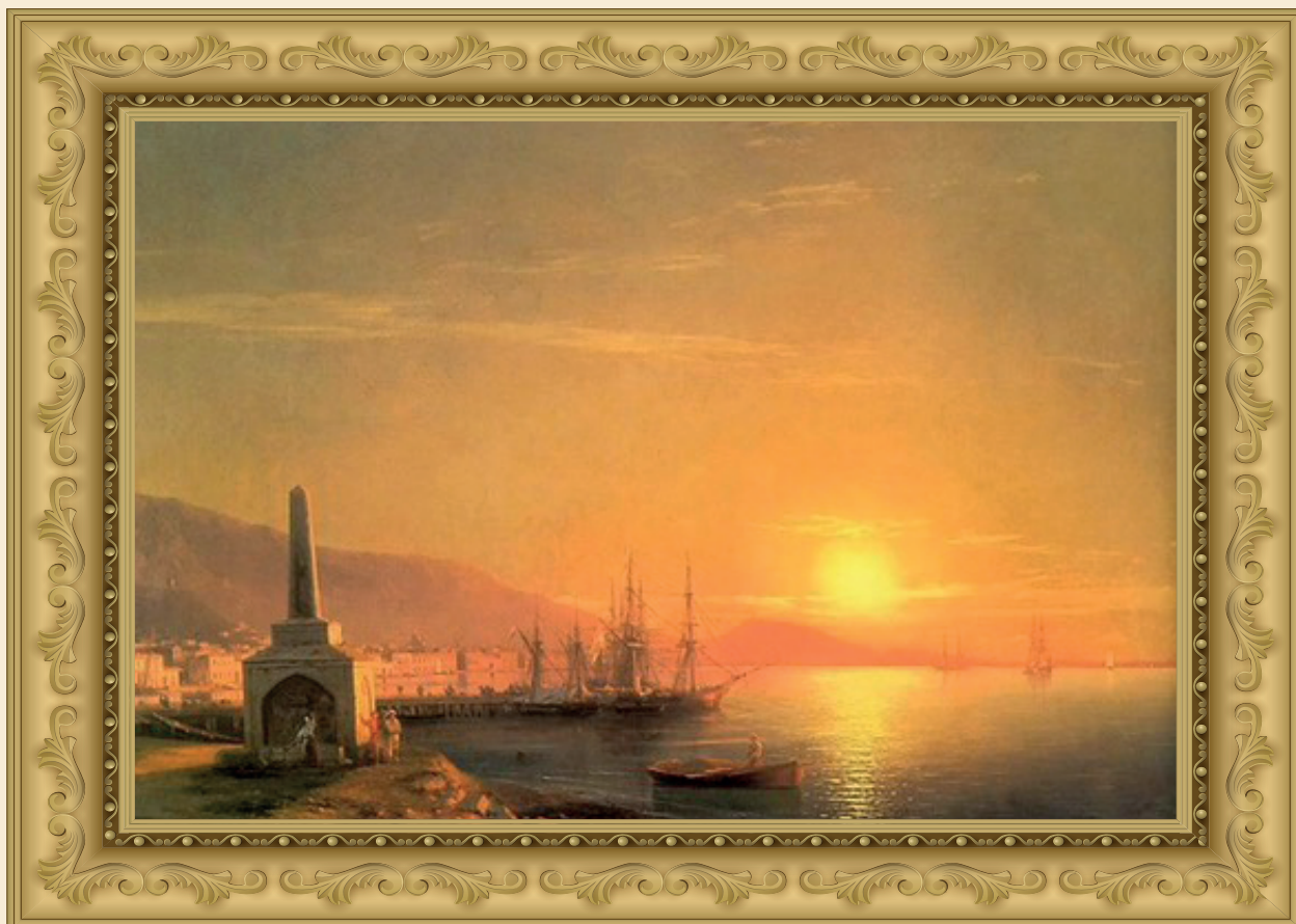
И. Айвазовский «Восход солнца в Феодосии» 1855 г.

В Феодосии прекрасной Много лет тому назад Появился на свет мальчик И прославил море так: